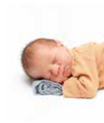
19 août 2024 Léonard THEOBALD