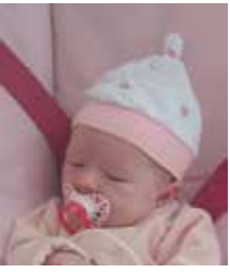
29 août 2024 Natalia HAUPTMANN